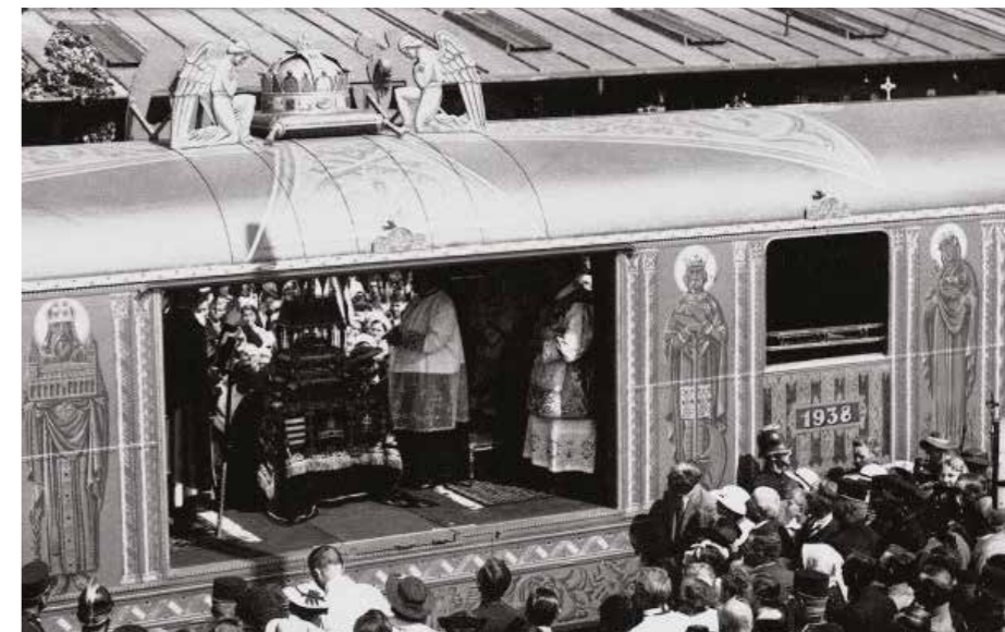
Az Aranyvonat 1938-ban Újdombóvár állomáson

Úgy, hogy elindultam Kenesétől, és végigmentem gyalog az északi parton, egészen Keszthelyig. Majd’ mindegyik települést körbejártam, és Révfülöpön találtam meg az ideális helyszínt: volt szőlő, pince, kilátás a tóra, és volt egy gyönyörű veranda. Egyedül nyári konyha nem volt, azt a díszleteseknek kellett odavarázsolni, de az épület egyébként tökéletesen passzolt a forgatókönyvhöz. A stáb is imádtá: mindenki lent lakott a Balatonon a forgatás alatt, együtt éltünk, este nagy pingpongszatók, nagy beszélgetések voltak – és nemcsak a filmben volt óriási lakoma (nem véletlenül szokták „a magyar nagy zabálás”-ként is emlegetni), de kamerán kívül, a forgatás után is jókat ettünk. Ennél a filmnél a színészek kiválasztása volt az egyik legkomolyabb feladat: lényegében a Kárpát-medence összes