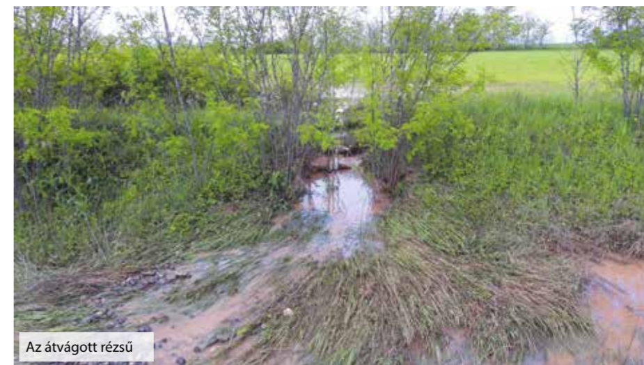
Az átvágott rézsű