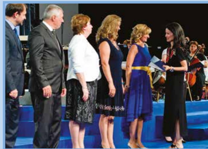
„... amikor a háttérzene is nagyobb hangerőre kapcsolt...”