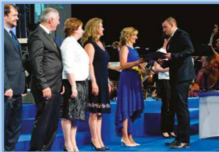
„... és amikor dübörgő taps tört ki...”