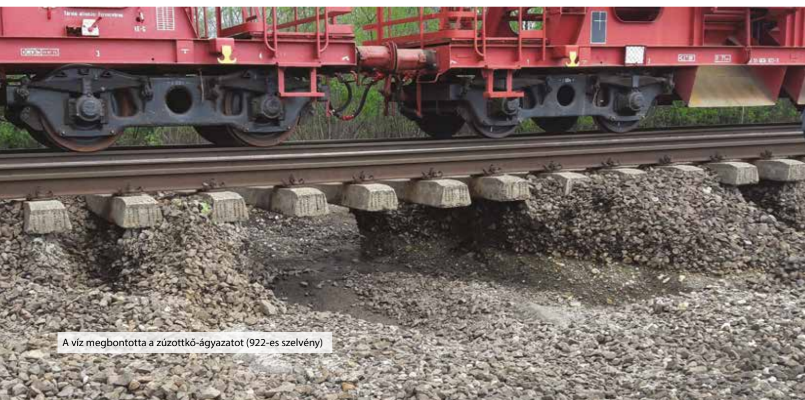
A víz megbontotta a zúzottkő-ágyazatot (922-es szelvény)