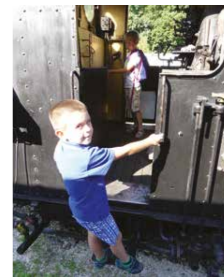
Vácsi Viktor Fotók: Gyermekvasút

A Gyermekvasút augusztus végéig a hét minden napján üzemel, a nyári menetrend szerint munkanapokon óránként, hétfőként 45 percenként indulnak a járatok.